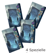
4 Spezielle Runenkarten

Diese neuen Runenkarten fordern eine Kombination von Golems, die während des Spiels beschworen werden müssen und gewähren 8 Gesamtpunkte (2 Punkte für jeden beschworenen Golem von der Anforderungskarte).