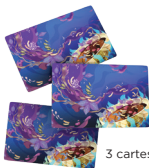
3 cartes Soif