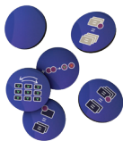
6 Segnalini Spezia

Le carte Assetato contano come carte Bevanda ma non possono essere usate né scartate all'inizio del tuo turno. Durante il tuo turno puoi rivelare e scartare uno dei tuoi segnalini Spezia per attivare la sua abilità.