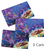
3 Carte Assetato